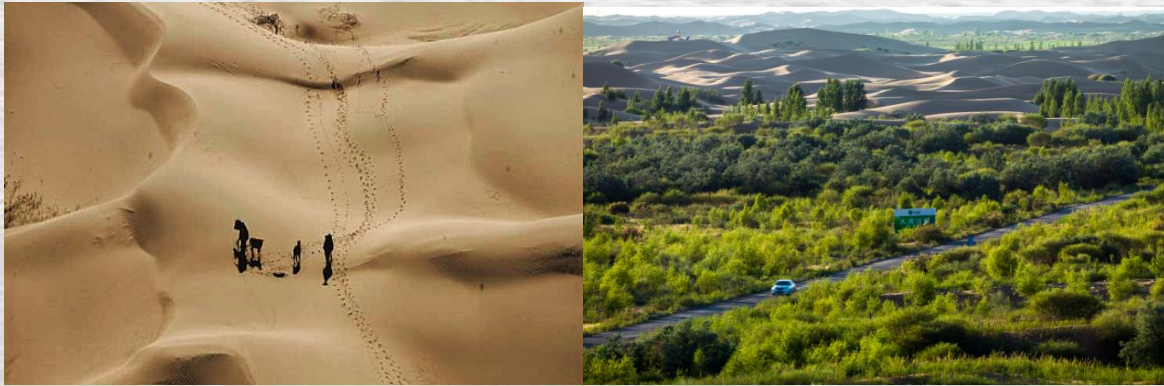
穿沙公路一带前后20年对比