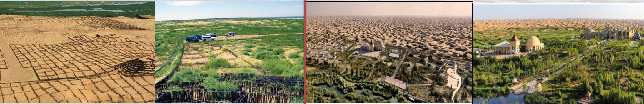
库布其沙漠郭三梁一角前后20年对比

第四阶段： 理性化、合理化治沙造林阶段（2003—2009）。主要特点：探索与总结科学的造林技术，积累经验，遵循“因地制宜、适地适树”的造林原则，提出“锁住四周、渗透腹部、以路划区、分块治理、科技支撑、产业拉动”的治沙方略和“路、电、水、讯、网、绿”六位一体的治沙方针。