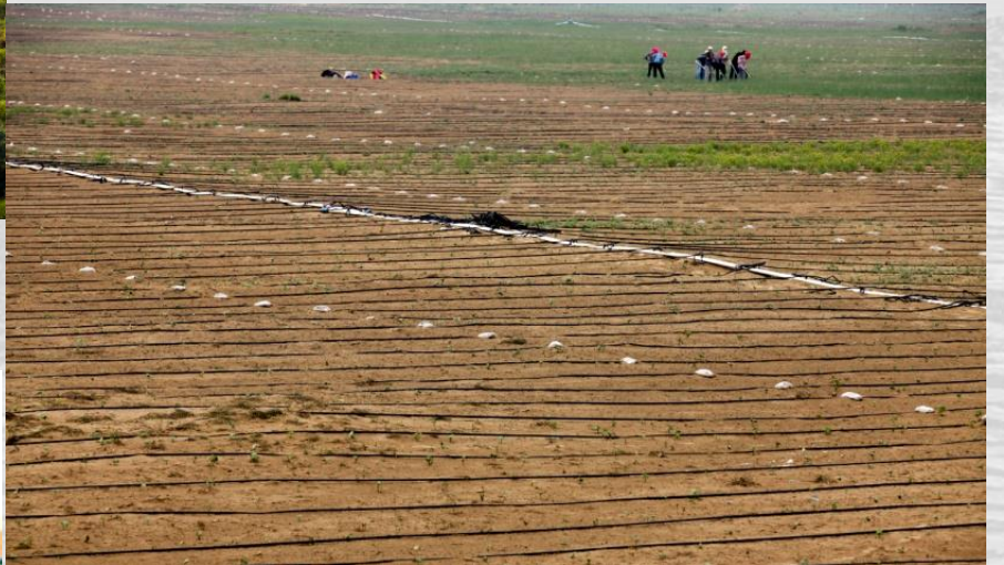
1000多平方公里的沙漠出现了表面结皮和黑色土壤